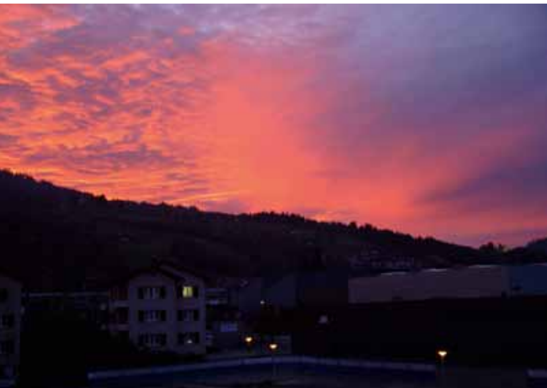
Der Himmel glühte am 18. Oktober über Horw, während die Tastatur der Blickpunkt-Redaktion rauchte.