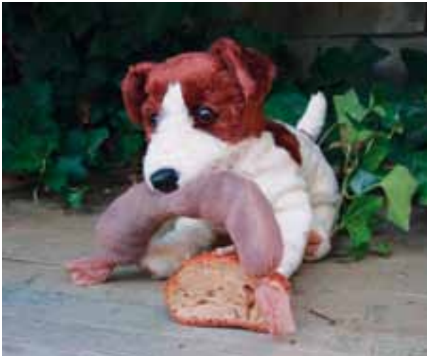
Hund Bello vom Figurentheater geniesst den Zvieri.