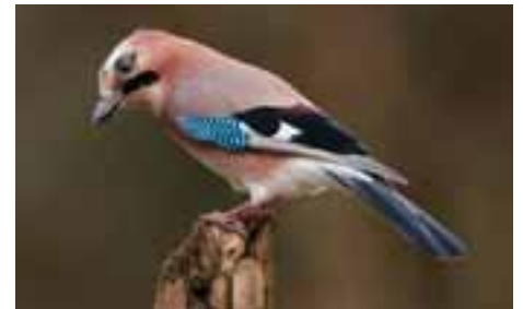
Eichelhäher ( Garrulus glandarius ).

Der Eichelhäher fällt durch seine rätschenden Rufe und sein prächtig gefärbtes Gefieder fast das ganze Jahr über auf. Er ist ein scheuer Vogel und verhält sich äusserst aufmerksam. Sein Warnruf macht nicht nur Artgenossen, sondern auch andere Vögel auf Gefahren aufmerksam. Er wird deshalb auch «Wächter des Waldes» genannt. Er imitiert zudem den Habichtruf oder ruft ähnlich wie der Mäusebussard.