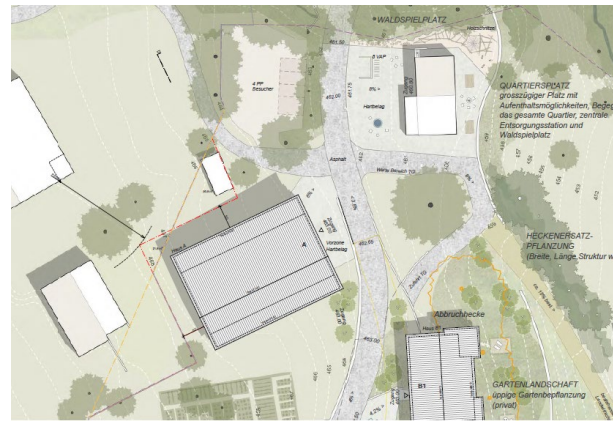
Abbildung 4: Situation Richtprojekt aktuell (A)