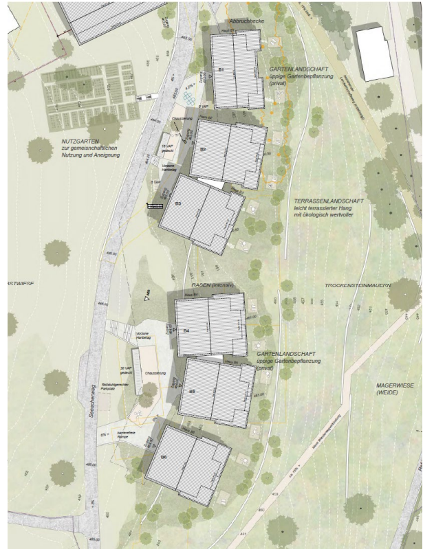
Abbildung 6: Situation Richtprojekt aktuell (B)