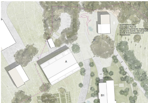
Abbildung 3: Situation Richtprojekt B+A 17. März 2022 (A)