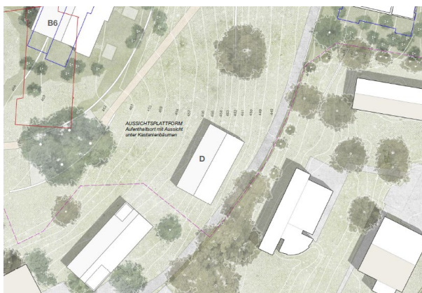
Abbildung 9: Situation Richtprojekt B+A 17. März 2022 (D)