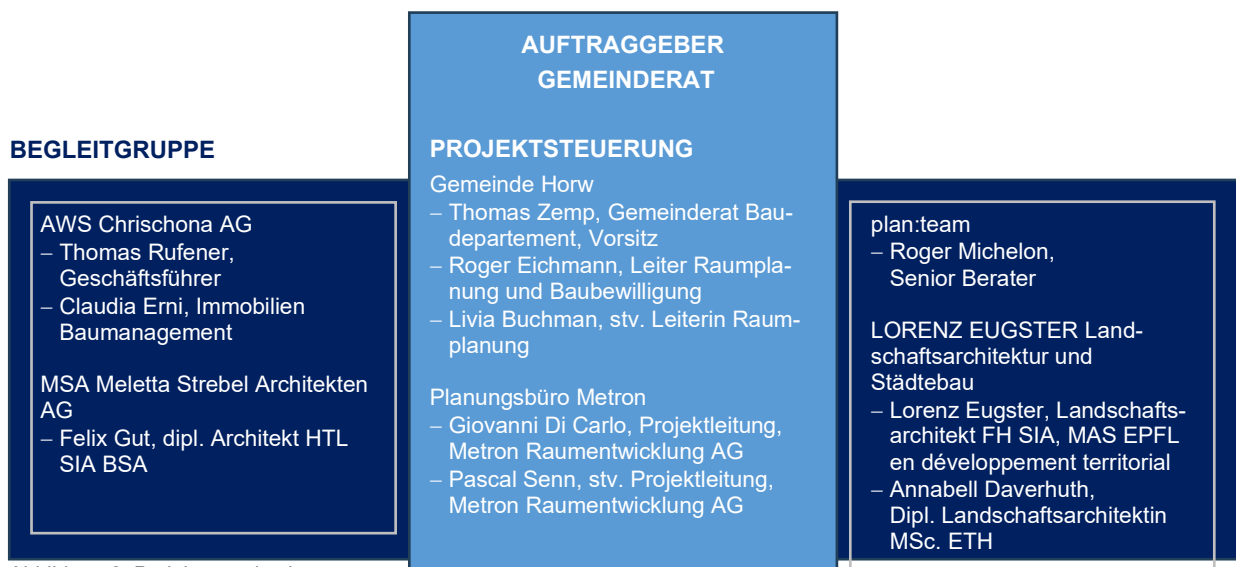
Abbildung 2: Projektorganisation

Für die Erarbeitung des Bebauungsplans und der Teiländerung Nutzungsplanung Chrischona wurde eine Projektsteuerung eingesetzt. Sie setzt sich aus externen Fachpersonen der Metron Raumentwicklung AG sowie Verwaltungsmitarbeitenden zusammen. Die Projektsteuerung stellt den regelmässigen Miteinbezug der Begleitgruppe sicher. Diese besteht aus den Verantwortlichen der AWS Chrischona AG und deren Fachplanerinnen und -planern aus Raumplanung, Architektur und Landschaftsarchitektur.