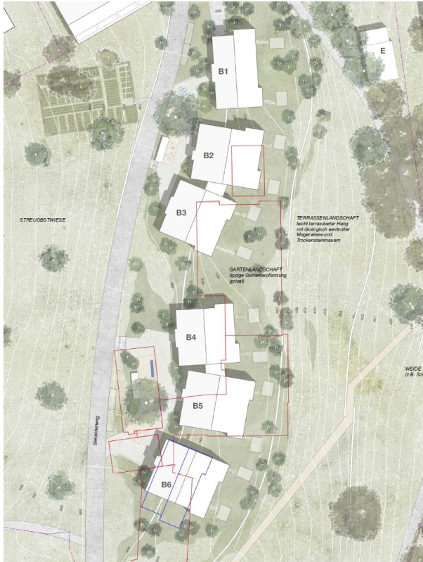
Abbildung 5: Situation Richtprojekt B+A 17. März 2022 (B)