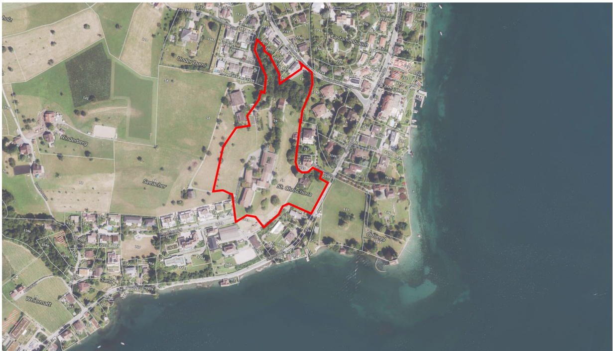
Abbildung 1: Grundstück-Nr. 59, GB Horw

Mit dem Bericht und Antrag Nr. 1695 Planungsbericht «Arealentwicklung Chrischona» vom 17. März 2022 hat der Gemeinderat dem Einwohnerrat die von der AWS Chrischona AG beabsichtigte Arealentwicklung zur Beratung und Kenntnisnahme unterbreitet. Der Einwohnerrat hat an seiner Sitzung vom 19. Mai 2022 den Planungsbericht einstimmig zur Kenntnis genommen. Seither wurde das Richtprojekt weiterbearbeitet und darauf abgestimmt der Bebauungsplan, die Sonderbauvorschriften und der Planungsbericht erarbeitet. Ebenso die Unterlagen für die Teiländerung der Nutzungsplanung. Das gesamte Planungsdossier wurde durch den Gemeinderat Ende März 2026 für die Auflage zur öffentlichen Mitwirkung und die kantonale Vorprüfung freigegeben.