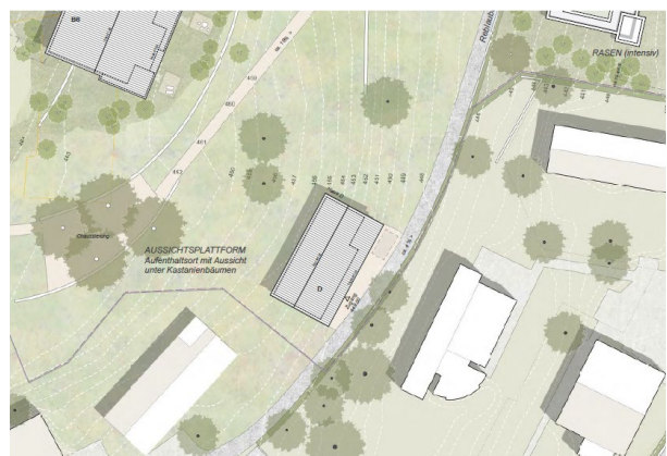
Abbildung 10: Situation Richtprojekt aktuell (D)