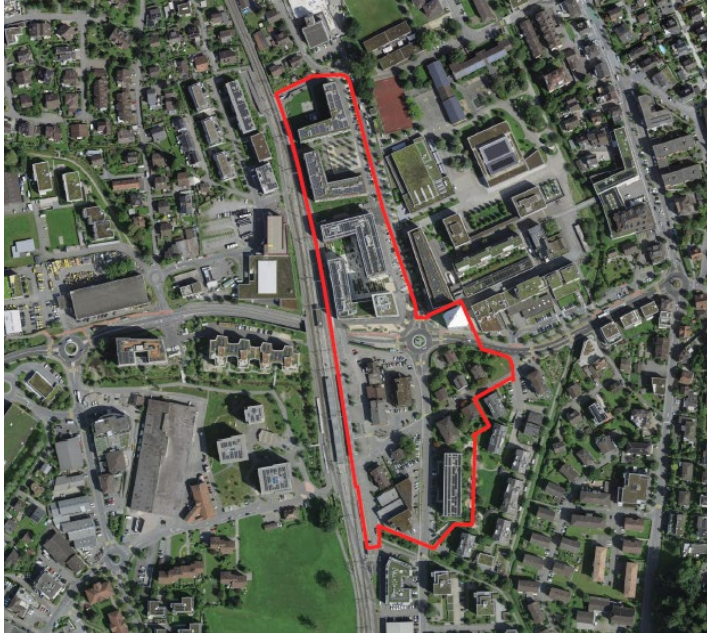
Abbildung: Bebauungsplanperimeter Teil Ost