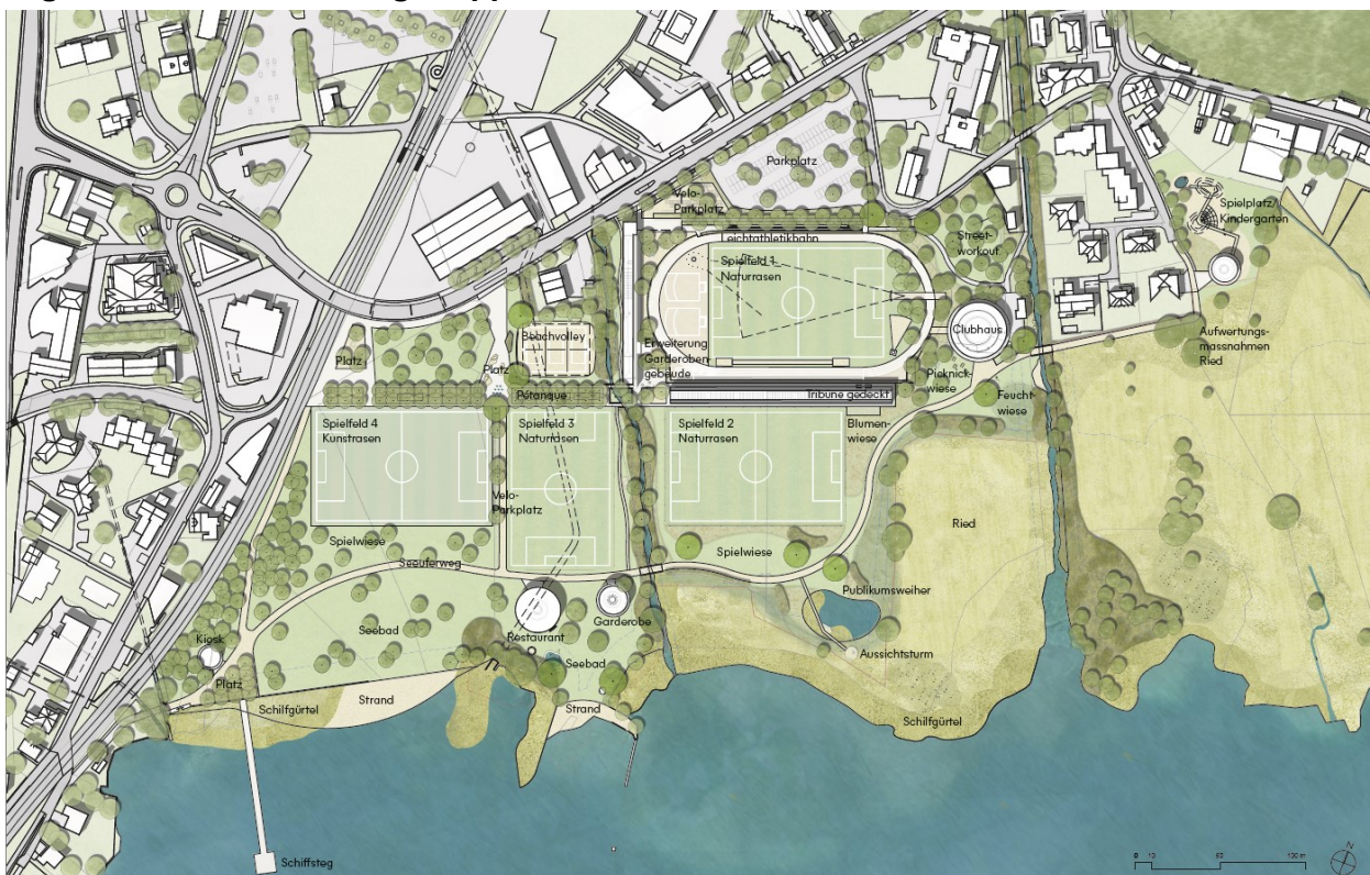
Fertig umgesetzte Vision Seefeld