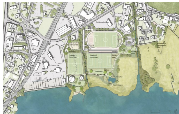
Nach Umsetzung Etappe 1 und 2 und 3