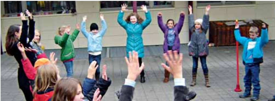
Die Schülerinnen und Schüler bei einem Tanz, anlässlich des Projekts «Bewegungsspass».

Während dem zweiten Semester dieses Schuljahres sind die Schülerinnen und Schüler des Schulhauses Hofmatt fleissig am Klebersammeln. Das Hofmatt-Team hat beschlossen, am Projekt «Bewegungs(s)pass», dem Nachfolgeprojekt von «rundum fit», teilzunehmen. Dabei erhält jede Klasse für jeweils drei Wochen ein bestimmtes Bewegungsmaterial mit dazugehörigen Aufgaben verschiedener Schwierigkeitsstufen. Für jede Aufgabe, welche ein Kind schafft, erhält es einen Kleber, den es in seinen Bewegungsspass kleben darf. Nach drei Wochen gibt jede Klasse ihr aktuelles Spielgerät weiter und erhält ein neues. So wird bis Ende Schuljahr jede Klasse Übungen zu sechs verschiedenen Bewegungsmaterialien machen können.