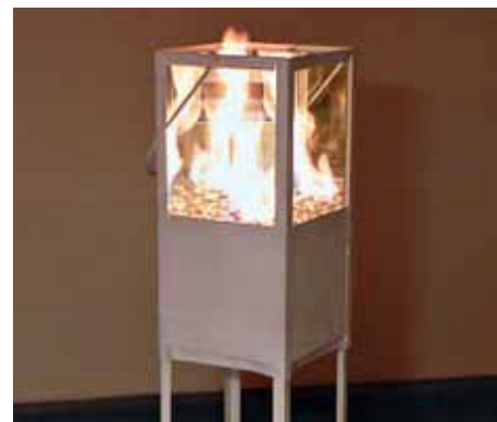
In immer mehr Haushalten gibt es Ethanolöfen.

Kaminlose Öfen, die mit Ethanol oder Brennsprit befeuert werden, kommen immer mehr in Mode. Hier die wichtigsten Sicherheitstipps: