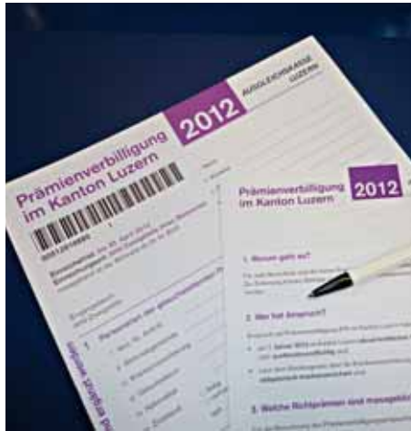
Bis zum 30. April kann man eine Verbilligung der Krankenkassen-Prämie geltend machen.

Ab 2012 können einer Person Betreuungsgutschriften auch angerechnet werden, wenn die pflegebedürftige verwandte Person nicht in Hausgemeinschaft lebt. Diese Bedingung ist erfüllt, wenn die pflegende Person nicht mehr als 30 Kilometer entfernt wohnt oder