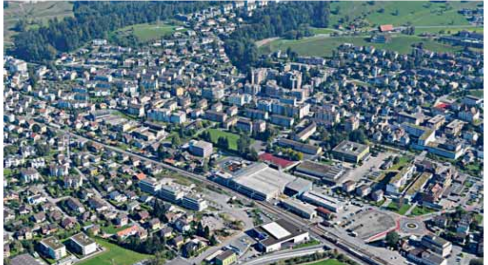
Der Ortskern von Horw wird sich in den nächsten Jahren stark verändern.

Attraktiver und bezahlbarer Wohnraum für alle Generationen sowie öffentliche und private Nutzungen sollen das Zentrum von Horw zusätzlich aufwerten und beleben. Mit der Abgabe der verfügbaren Baufelder im Baurecht an die Baugenossenschaften Pilatus, Familie und Steinengrund setzt die Gemeinde ein Zeichen für den gemeinnützigen Wohnungsbau und für das Alterswohnen. Mit einem Anteil von 20 bis 25 Prozent sollen altersgerechte Wohnungen zur gewünschten Durchmischung im Ortskern beitragen. Es wird ein Investitionsvolumen von 40 bis 50 Millionen Franken ausgelöst. Bis 2015 soll damit die Zentrumsüberbauung mit einer sinnvollen Verdichtung abgeschlossen werden.