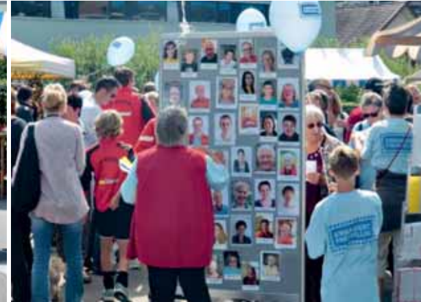
Mit einem grossen Fest wurde die Freiwilligenarbeit anlässlich des Frühlingsmarkts der Bevölkerung nähergebracht.