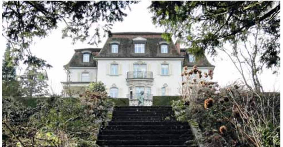
In der Villa Krämerstein befindet sich heute eine internationale Sprachschule, der Park ist öffentlich.

liess ein Gärtnerhaus, ein Bootshaus und ein Pflörtnerhaus bauen. 1942 zog dessen Sohn ein und vermachte das Anwesen bei seinem Tod im Jahre 1980 dem Verkehrshaus der Schweiz in Luzern. Keller, ein Schiffsliebhaber, hatte schon 1959 seine Modellsammlung dem damals neu eröffneten Museum vermacht.