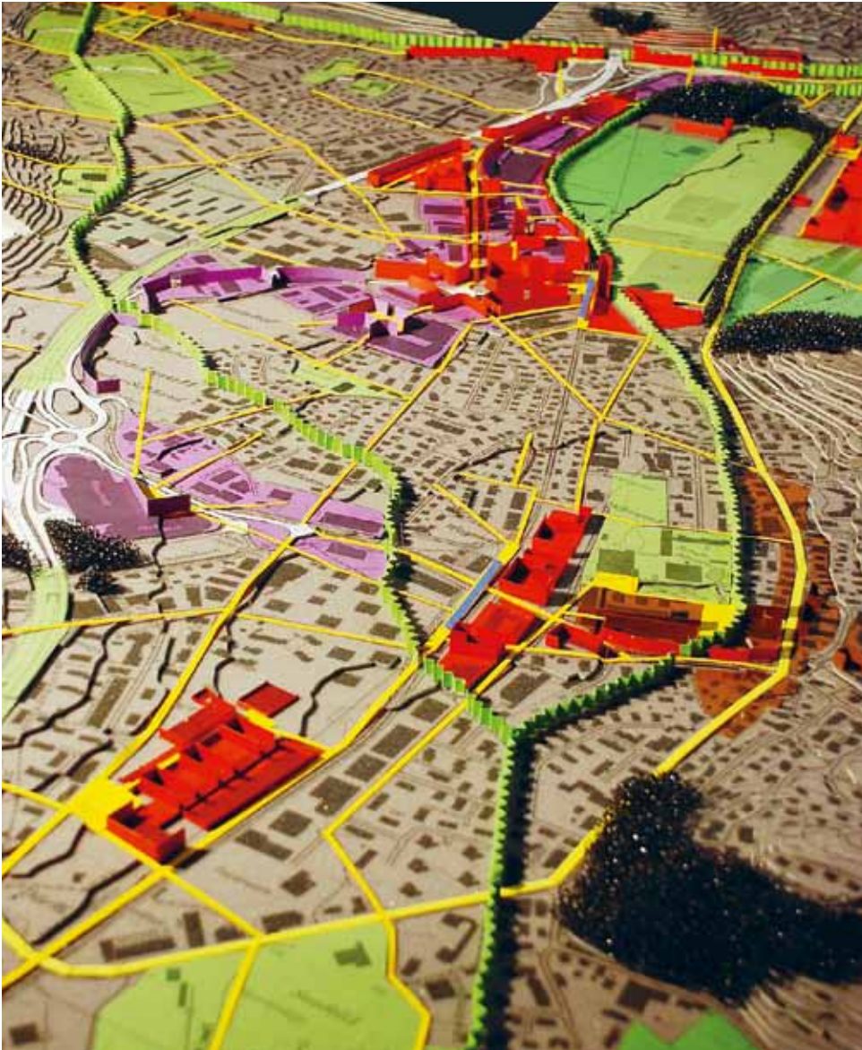
Modellaufnahme: unten Steinibachried, Bildmitte Bahnhof/Horw Zentrum, oben Grosshof, Eichhof und Allmend. Grün: Grünraum mit Promenade für Langsamverkehr; hellgelb: Hauptstrassen; gelb: Fuss- und Radwegachsen.