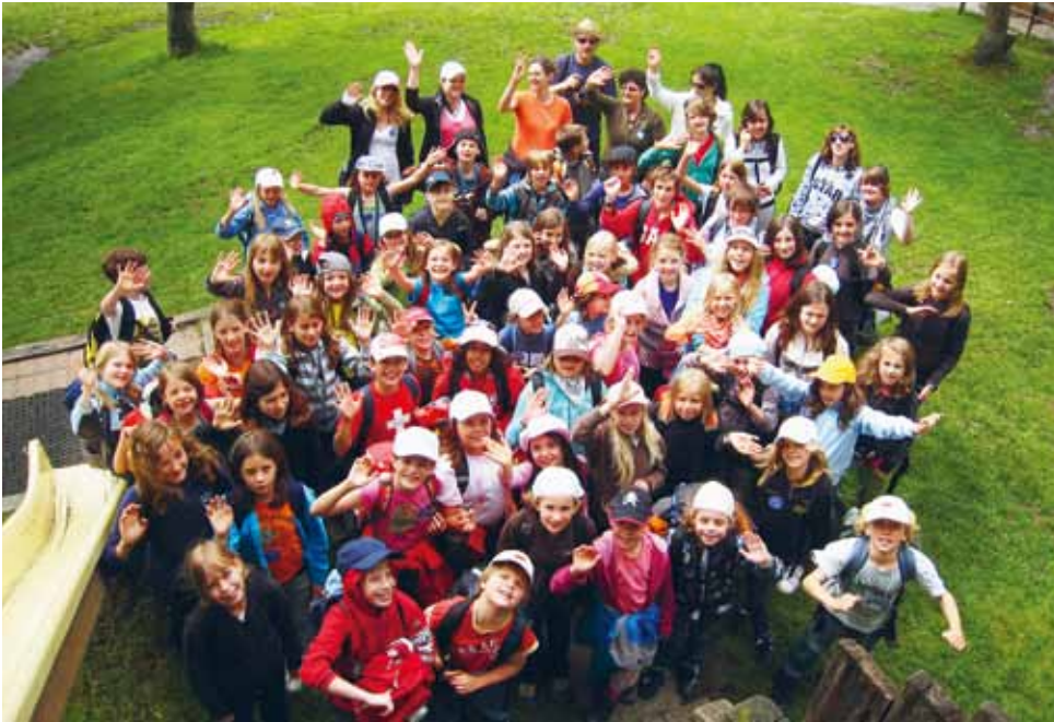
Zufriedene und fröhliche Kinder – das ist das Ziel der Schulen und der ergänzenden Freizeitangebote in Horw, wie zum Beispiel hier der Jugendchor Nha Fala.