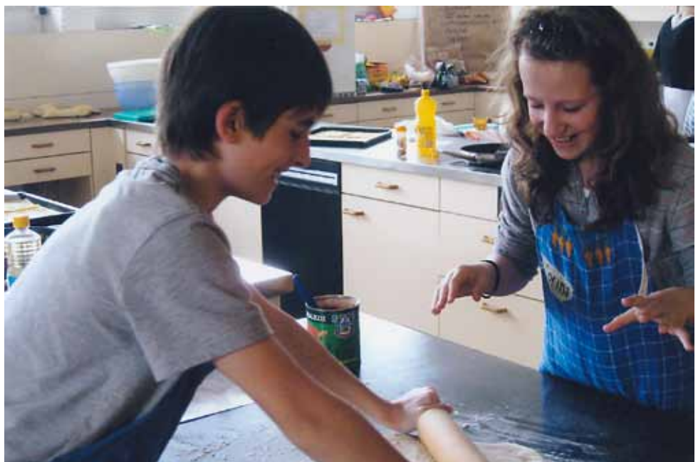
Teigen macht Spass!