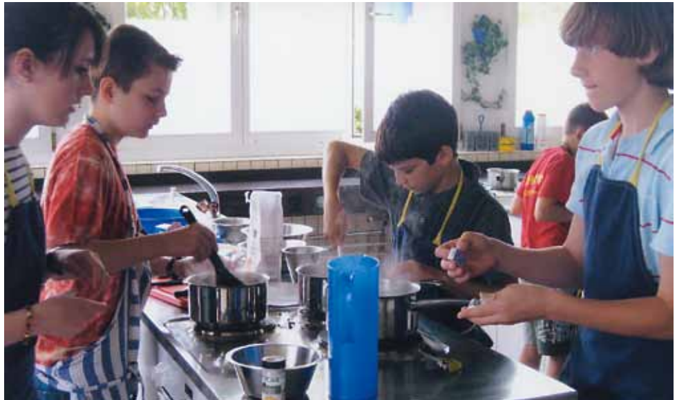
Kochen im Team