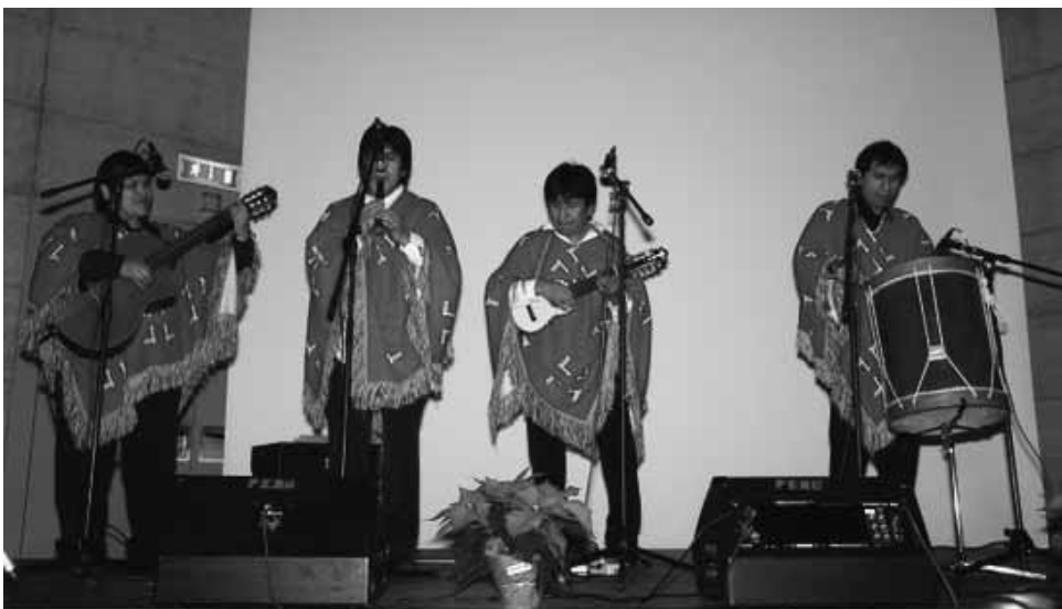
Neujahrsapéro vom 1. Januar 2008: Auftritt der Musikgruppe Orquesta Acuarela